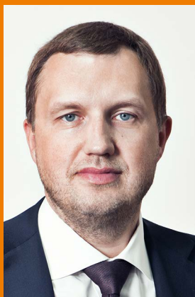
ПОМЕЛОВ СЕРГЕЙ АНАТОЛЬЕВИЧ Президент

Численность персонала – более 9 тыс. человек.