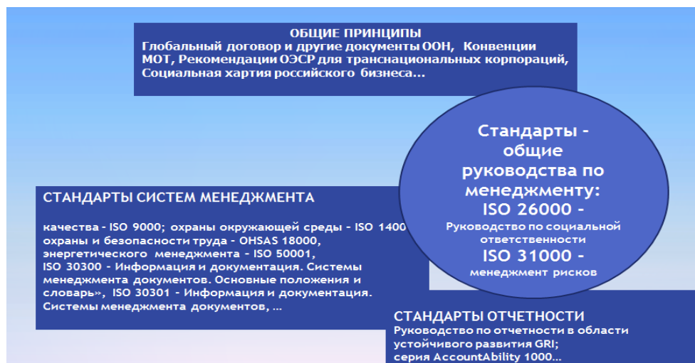
Рис.1 Место стандарта ISO 26 000 в комплексе документов, отражающих международно признанные представления о принципах социальной ответственности и путях добровольного их внедрения в практику организаций.

В комплексе документов, отражающих международно признанные представления о принципах социальной ответственности и путях добровольного их внедрения в практику организаций, стандарт ISO 26 000 служит «связующим звеном» между сводами общих принципов и системами практического решения конкретных проблем в сфере социальной ответственности организаций, а также системами отчетности, отражающей результаты этой деятельности.