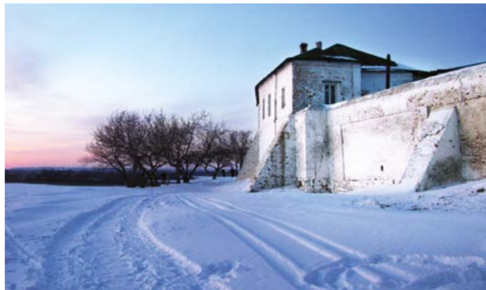
в Камергерском переулке.

Благодаря содействию БФ «РЕНОВА» был заключен авторский договор на производство, а также согласовано с правительством Москвы возведение памятника К.С. Станиславскому и В.И. Немировичу-Данченко