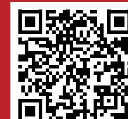
Цифровая версия годового отчета БФ «РЕНОВА»