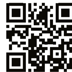
Сайт Политехнического музея

За полгода с момента закрытия основного здания на реконструкцию Политехнический музей доказал: жить вне стен родного дома можно и иногда даже нужно, ведь это открывает перед тобой совершенно новые возможности для демонстрации своих способностей.