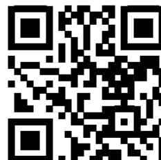
Сайт специальной школы-интерната IV вида

Участие в данной работе не только позволило школьникам превратить в жизнь собственные идеи, как сделать жизнь в интернате интереснее и разнообразнее, но и дало им хорошую возможность попробовать силы в создании и реализации реальных проектов, потренироваться в подготовке конкретных материалов, презентаций, умения убеждать. Помимо этого, такая работа благотворно сказалась на их самооценке, самодисциплине и организованности. Безусловно, подобная внеклассная активность будет полезной для подростков и в плане подготовки к реальной профессиональной деятельности после окончания школы. Три проекта будут профинансированы на сумму 68 988 рублей.