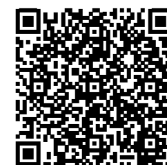
БФ «РЕНОВА» на Facebook

ФОРМЫ РАБОТЫ С ВОЛОНТЕРАМИ • рассылка информации • организация практики • включение в проекты • специальная программа «Личная благотворительность»