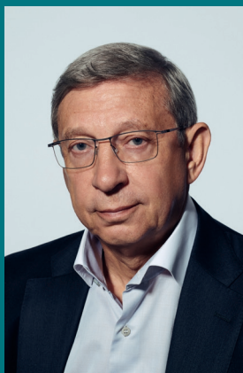
ЕВТУШЕНКОВ ВЛАДИМИР ПЕТРОВИЧ Основатель

АФК «Система» – российская инвестиционная компания, основана в 1993 г. Диверсифицированный портфель активов более чем в 20 отраслях экономики, включая телекоммуникации и цифровые сервисы, ИТ и микроэлектронику, финтех и электронную коммерцию, лесопереработку и сельское хозяйство, недвижимость и гостиничный бизнес, медицинские услуги, фармацевтику и биотехнологии, электроэнергетику и водородные технологии.