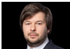
ПАВЕЛ СОРОКИН Заместитель Министра энергетики РФ