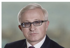
АЛЕКСАНДР ШОХИН Президент РСПП