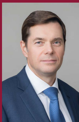
МОРДАШОВ АЛЕКСЕЙ АЛЕКСАНДРОВИЧ Председатель Совета директоров

ALEXEY MORDASHOV Chairman of the Board of Directors