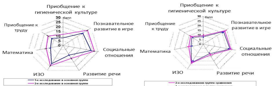
а) основная группа, получающая напитки и кисели с витаминами